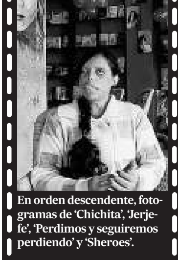
En orden descendente, fotografías de 'Chichita', 'Jerjefe', 'Perdimos y seguiremos perdiendo' y 'Sheroes'.