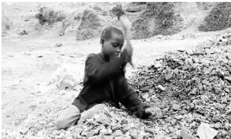
Un niño, en una escena de 'Un día de campo', de Carlos Caro.