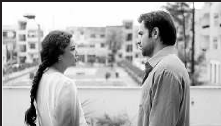
Arriba, escena de 'En tierra extraña'; a la izquierda, la protagonista de 'Difret'; al lado, una pareja en una escena de 'Tigers'.